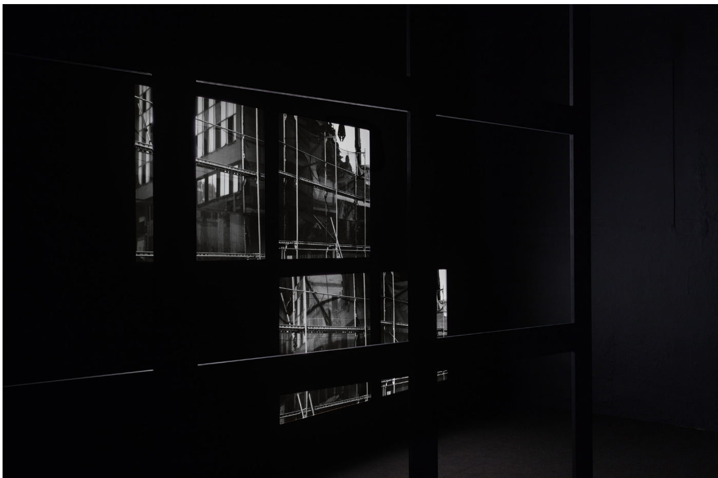
Paul Kuimet, Grid Study, 2016, installation view.